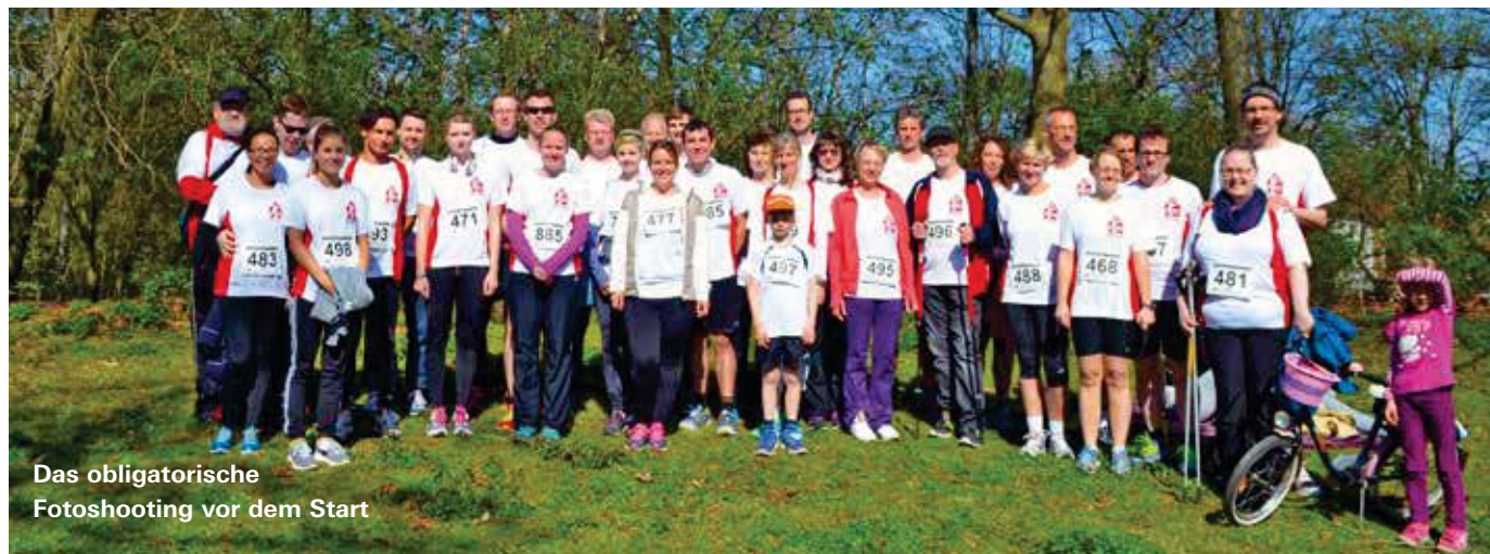
Das obligatorische Fotoshooting vor dem Start