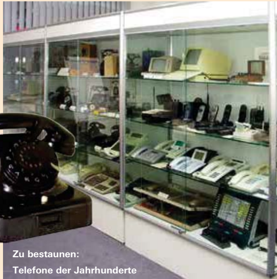
Zu bestaunen: Telefone der Jahrhunderte