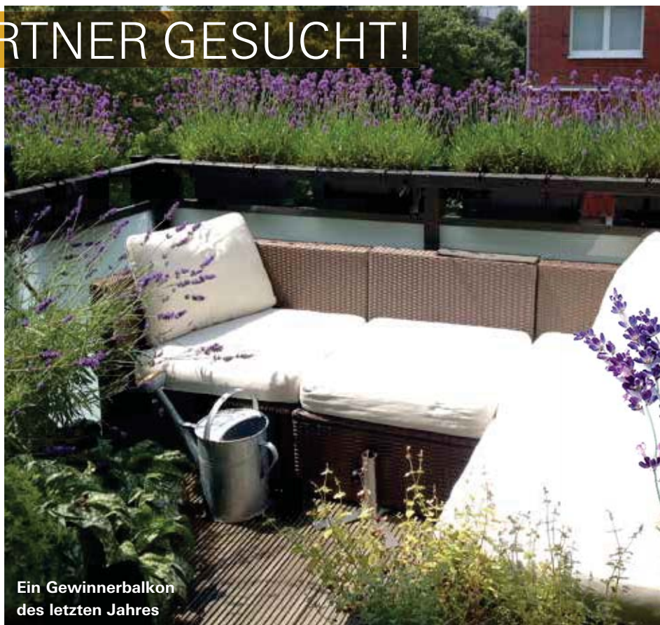
Ein Gewinnerbalkon des letzten Jahres

Lavendel gehört zu den wichtigsten Pflanzen der Naturheilkunde und hält zudem, in Säckchen gefüllt, die Motten fern.