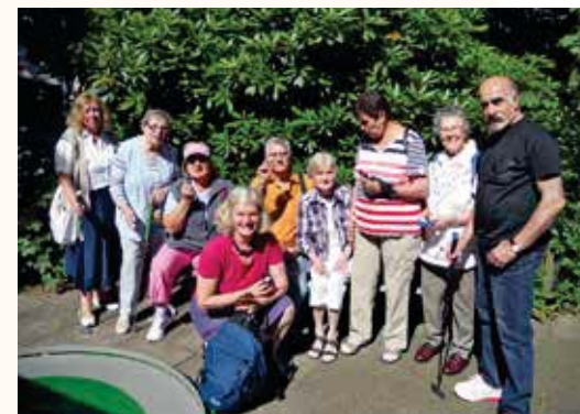
Und wer gewinnt dieses Mal?

Am Donnerstag, 2. Juli machen wir uns um 15.30 Uhr gemeinsam vom „SieNa“ aus auf den Weg zur Minigolfanlage im Hammer Park. Wie schon in den vergangenen Jahren stärken wir uns zuerst an einer mitgebrachten Schokokusstorte. Kaffee gibt es vor Ort zu kaufen. Dann sind wir fit für die sportliche Herausforderung und schwingen eine Runde lang die Golfschläger. Wer noch einen Kuchen mitbringen möchte, sage bitte vorher im "SieNa" Bescheid. Anmeldung erbeten bis Mittwoch, 1. Juli. Eine Runde Minigolf kostet 3,50 Euro.