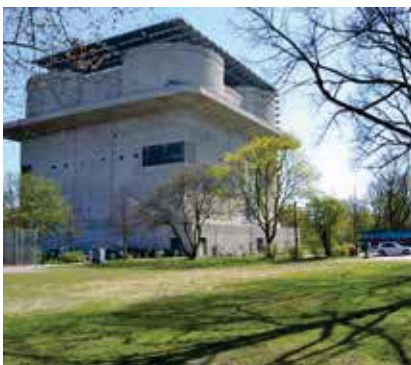
Ein imposantes Gebäude

Der Rundgang von 16.00 bis 17.30 Uhr ist kostenlos, Anmeldung bis zum 22. Juli erbeten.