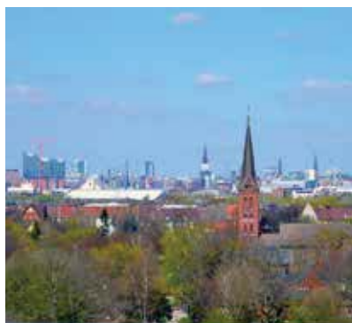
Blick vom Bunker