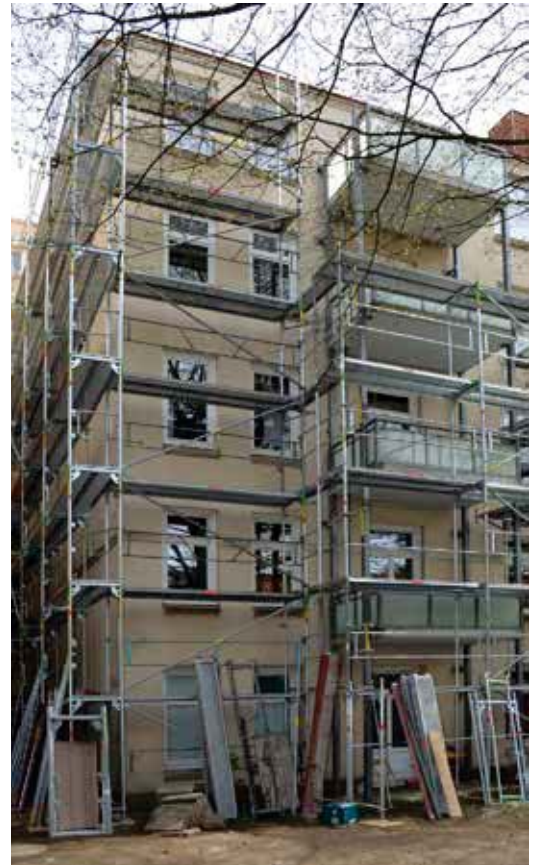
Im Innenhof dominiert das frisch aufgestellte Gerüst.

Im September sollen die Arbeiten abgeschlossen werden. Dann können auch die Gartenanlagen wiederhergestellt werden – und der Innenhof hat seine Beschaulichkeit zurück.