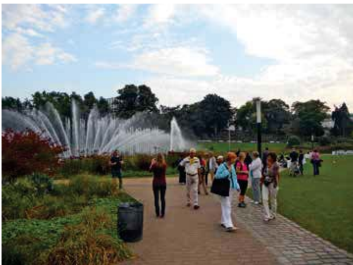
Bunte Wasserlichtspiele mit Musik

Nachdem die Konzerte in den Jahren 2013 und 2014 kurzfristig abgesagt wurden, geben wir dem Polzeiorchester am Mittwoch, 3. Juni um 15.00 Uhr erneut Gelegenheit, uns zu erfreuen. Wenn wir wieder Pech haben sollten, besuchen wir das Wasserspielkonzert um 16.00 Uhr. Dabei genießen wir die wunderschöne Bepflanzung bei einem Eis oder einer Tasse Kaffee in netter Gesellschaft. Abfahrt per HVV vom „SieNa“ um 14.10 Uhr, Anmeldung erbeten bis Montag, 1. Juni.