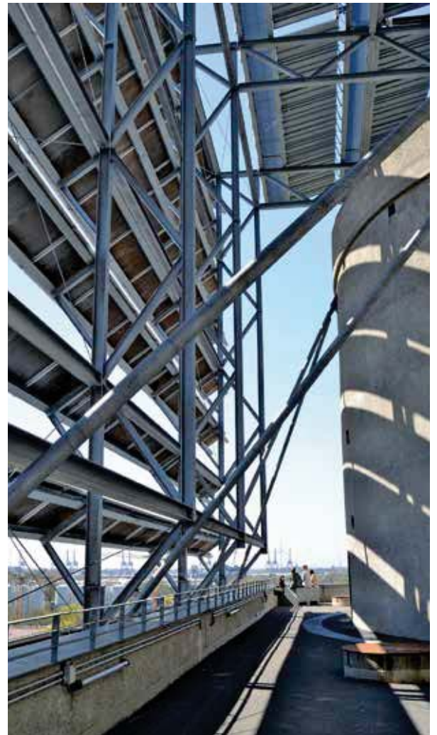
Vom Flakbunker zum Kraftwerk