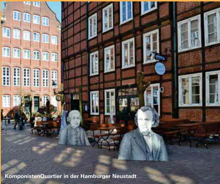
KomponistenQuartier in der Hamburger Neustadt

Hamburg besitzt eine einzigartige Musiktradition. Bedeutende Komponisten, wie Telemann und Brahms haben hier gewirkt oder wurden hier geboren. Im KomponistenQuartier finden wir drei Museen in Hamburger Kaufmanns- und Bürgerhäusern. Gemeinsam können wir hinter die Kulissen schauen: Wer waren die musikalischen Akteure? Wie lebten sie? Wie klingt ihre Musik? Wir besuchen die Telemann-Bach-Hasse-Ausstellung am Donnerstag, 18. Juni . Nach einer halbstündigen Führung haben wir Gelegenheit, die Geschichte der Musikstadt Hamburg zu entdecken, auch im angrenzenden Brahmsmuseum. Wer mag, kommt hinterher noch mit ins Paulaner's am Großneumarkt zum Mittagstisch. Der Eintritt kostet mit Führung 4,- Euro, Abfahrt vom „SieNa“ per HVV um 10.14 Uhr. Die Anmeldung ist bis Donnerstag, 11. Juni möglich.