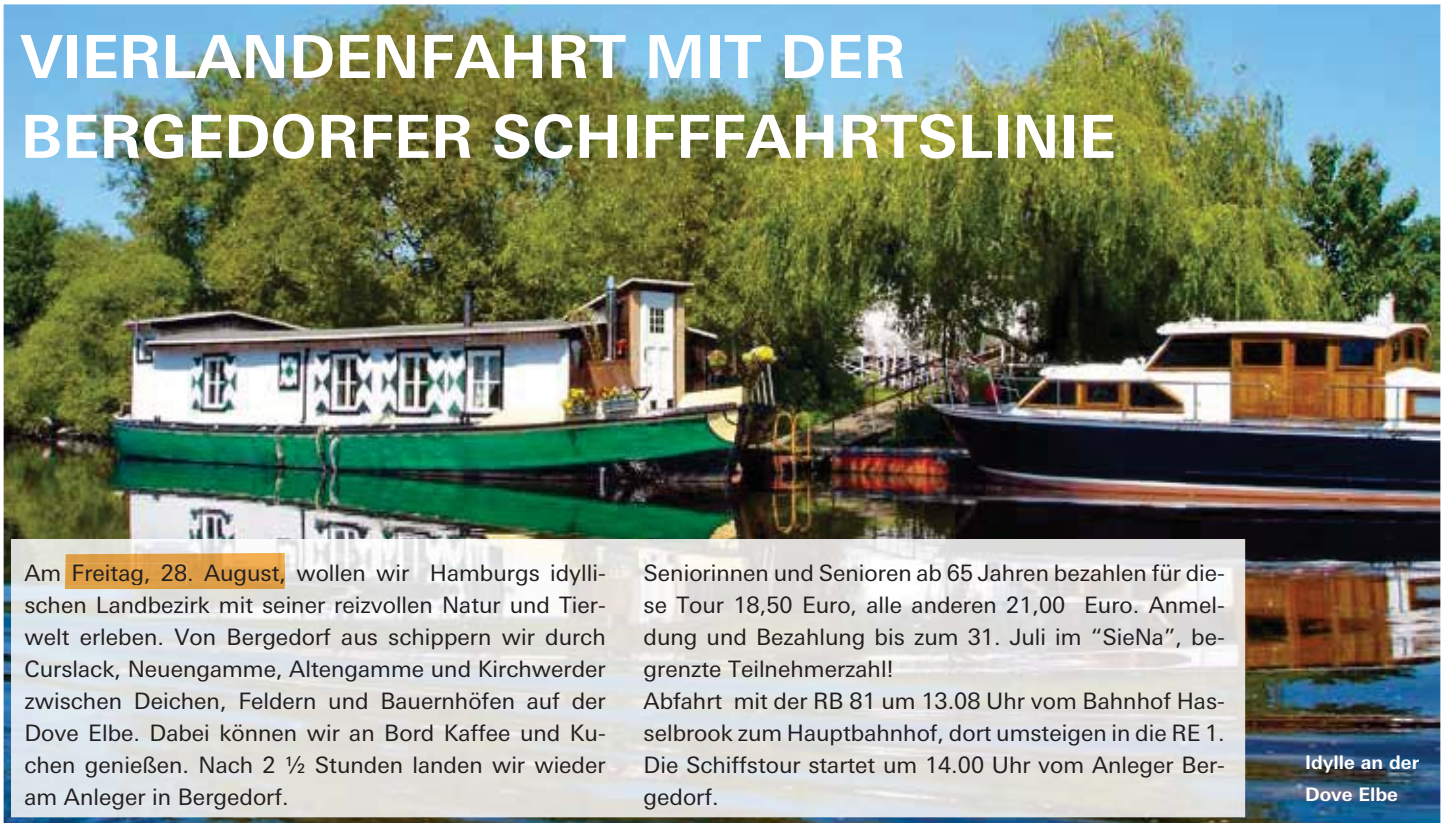
Idylle an der Dove Elbe

Am Freitag, 28. August , wollen wir Hamburgs idyllischen Landbezirk mit seiner reizvollen Natur und Tierwelt erleben. Von Bergedorf aus schippern wir durch Curslack, Neuingamme, Altengamme und Kirchwerder zwischen Deichen, Feldern und Bauernhöfen auf der Dove Elbe. Dabei können wir an Bord Kaffee und Kuchen genießen. Nach 2 ½ Stunden landen wir wieder am Anleger in Bergedorf.